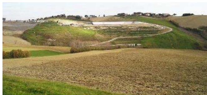
Una vista panoramica dell'impianto della ASA Azienda Servizi Ambientali s.r.l. a Corinaldo.

di valorizzarli e rispettarli attraverso una gestione consapevole ed organica. Questo cammino l' ASA l'ha intrapreso nel 2004 quando il proprio Sistema Integrato (Qualità & Ambiente) veniva riconosciuto